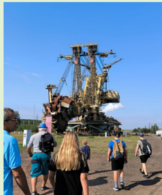
Velkorýpadlo KU 800 Březenský Drak, sportovní aktivity