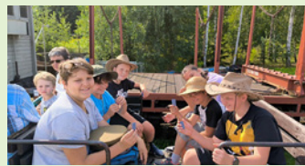
ERASMUS+15.9.-21.9.2024 Výměna mládeže ZŠ Litvínov – Hamr