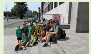
Vodní doprava – cestování lodí z Ústí

Žáci naší školy se na počátku tohoto školního roku zúčastnili výměny mládeže programu ERASMUS+. 10 dětí z 8. a 9. třídy jelo na 7 dní pod záštitou organizace YTC RADKA v Kadani do Vykmanova u Perštejna, kde je čekal týden aktivit s žáky ze Slovenska na téma EKOLOGIE. My jsme zastupovali Českou republiku a ze Slovenska přijeli děti z Centra volného času Stará Ľubovňa.