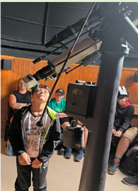
Vesmír – návštěva hvězdárny v Mostě, poznávací aktivity